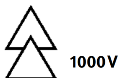
Bildzeichen IEC-60417-5216 (DB:2002-10); geeignet zum Arbeiten unter Spannung; Doppeldreieck und Angabe der Spannung.